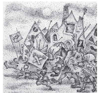
Der Umzug (Ausschnitt), satirische Federzeichnung, 1963