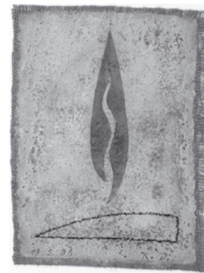
Zypresse, Kohle, Pastell, 2006