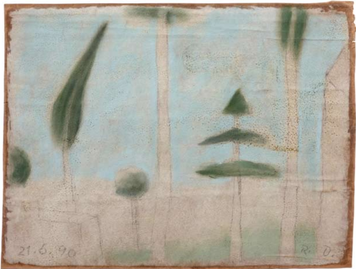
Südländischer Park 1990 Bleistift, Pastell, 32,5 x 43 cm