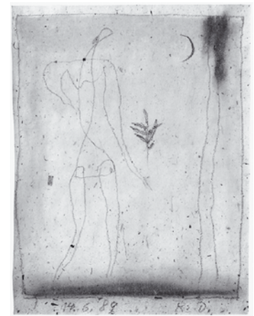
Figur mit Zweig vor Landschaft mit Mond, Bleistift und Pastell, 1989

Ein großer Teil der Papierarbeiten entstand nicht zuletzt aus Gründen des leichteren Transports in Dillens Amsterdamer Domizil, das er sich von 1991 bis 2005 eingerichtet hatte. So hatte es ihn ohnehin auf den Spuren seiner Vorfahren schon lange immer wieder in die Niederlande gezogen. Das Faszinierendste dieser schillernden Kulturstadt war für Rainer Dillen das breitgefächerte Angebot auf dem Gebiet der Musik, das ihn auch künstlerisch animierte. Zu diesen Höhepunkten der Amsterdamer Bilder gehört