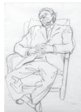
Vater im Stuhl, Kohlezeichnung, 1960