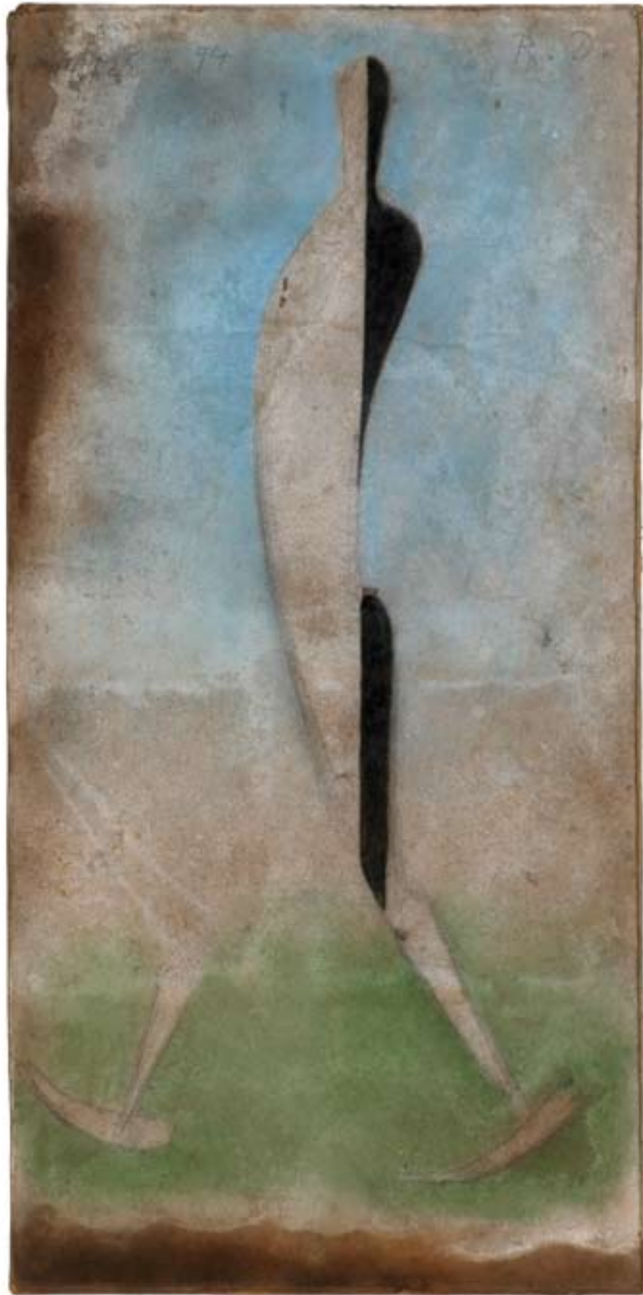
Männliche Figur, schreitend 1994 Kohle, Pastell, 73 x 36 cm