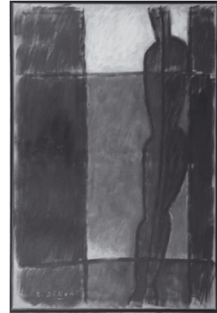
Ich ausschauend, Öl, 2001

Im Jahr 2002 nimmt das Ölbild „Ich ausschauend“ das rahmende Tor-Motiv auf, das schon bei der frühen „Schicksalsfigur“ eine entscheidende Rolle spielte und eine neue Entwicklung anzukündigen schien. Tatsächlich gibt es auch in den Werken der letzten Jahre Veränderungen. So führen die jüngsten Arbeiten zusammen, was sich vorher gegenüber stand: Erzählerisches, sich bewegende Figuren (z.B. Paarstudien, S. 78, S. 86 und S. 90) und surrealistisch harte Körperschatten wie bei „Männliche Figur mit Flamme“ (Titelbild) erinnern an die Traumwelten der 70er Jahre; und die noch weitergehende Reduktion der Figuren und Zeichen auf minimale und zunehmend allgemeingültigere Chiffren wie Schlange, Himmelskörper, Erde, Feuer, Pflanze und Mensch verweisen in den Bereich des Mythischen und Konstruktiven der späteren Arbeiten.