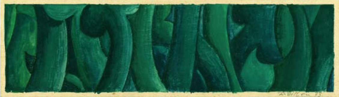
Urwald, Entwurf für ein Wandgemälde 1973 Tempera, 5,5 x 21 cm