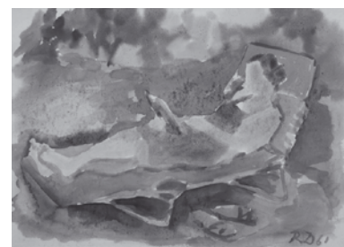
Mutter im Garten, Aquarell, 1961