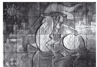
Betonrelief „Jeanne d’Arc“ (Ausschnitt), Mädchen-Realschule Rosenheim, 1964