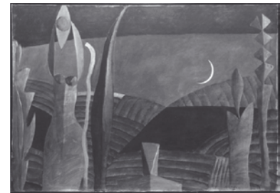
Männliche und weibliche Figur vor Landschaft (Schöpfungsbild), Aquatec auf Leinwand, 1977

In der melancholischen Grundstimmung schwingt immer auch das Thema Tod mit. In den wenigsten Bildern allerdings bedarf es noch der ausdrücklichen Thematisierung, um als Gegenpol zum Leben spürbar zu werden. Hatte Dillen 1968 in einer Federzeichnung zum „Karfreitag“ den Tod noch mit gesellschaftskritischen Aspekten verbunden und sich ihm 1970 in der Zeichnung eines aufgebahrten alten Mannes realistisch, 1975 in einer umgebogenen „Blütenstab“-Gestalt (S. 21) symbolisch sowie 1979 im „Stillleben mit Totenkopf“ (S. 29) kunsthistorisch angenähert, so erscheint die 1984 entstandene „Ruhende Figur“, der Vater auf dem Sterbebett, als eigene Metapher von unverrückbarer Gültigkeit. Vor allem als der Tod sich 1999, in einem wiederum aus der Kulturgeschichte vertrauten Motiv „Das Mädchen und der Tod“ (S. 71), als personifizierte Gestalt ebenso zärtlich wie bestimmt einer jungen Frau zuwendet, wird Dillens persönliche Vertrautheit mit seiner Gegenwart greifbar.