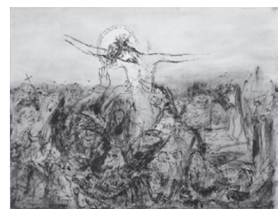
Karfreitag, Die Gesellschaft, Tuschezeichnung, 1968