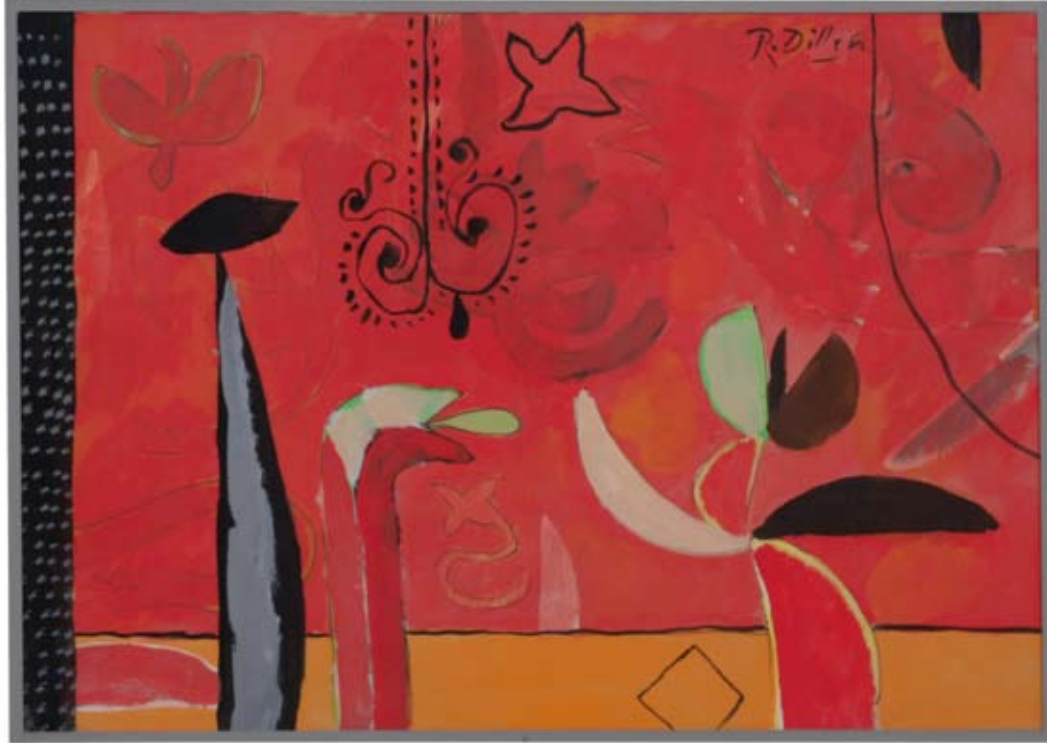
Bühnenszene um 1975 Tempera, 28,5 x 40,5 cm