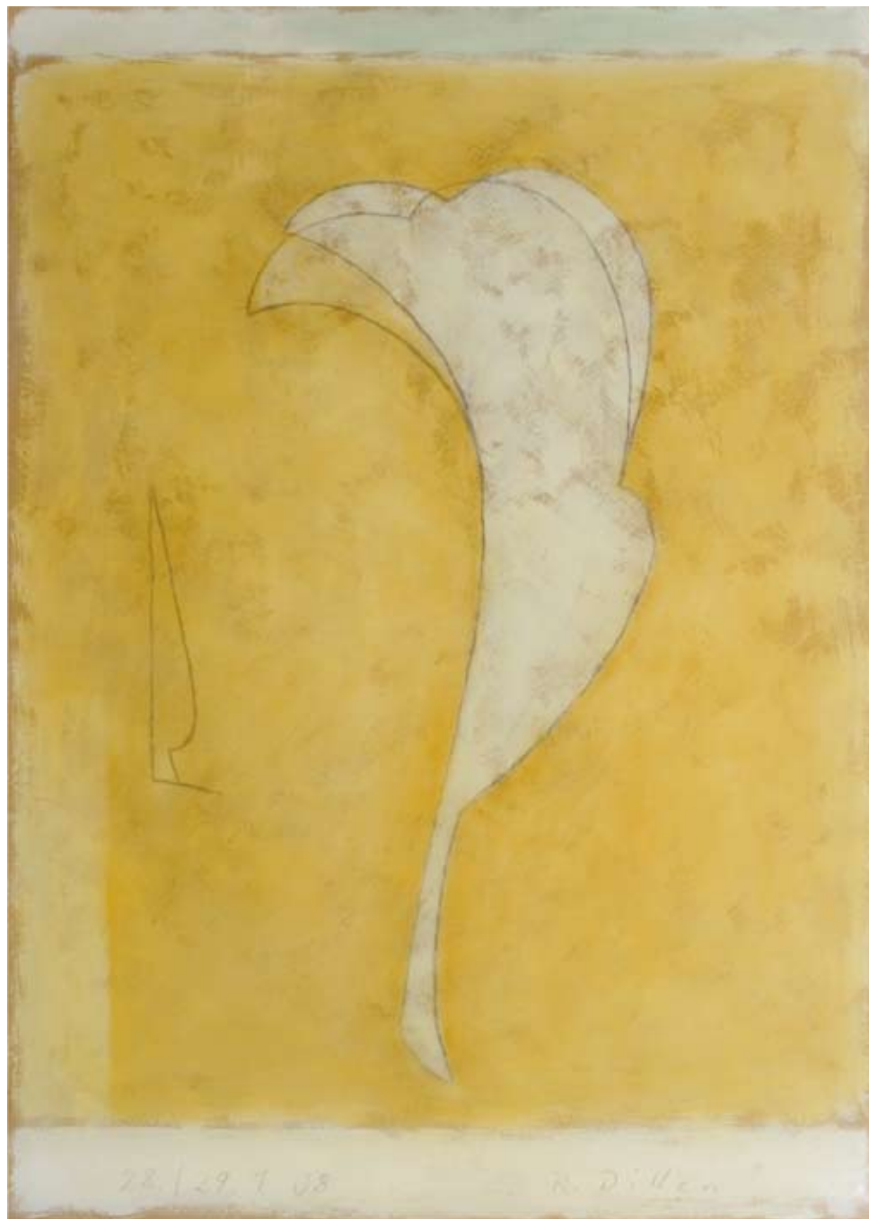
Vegetativ figürlich, geneigt vor Gelb 2008 Gouache, Kohle, Pastell, 140 x 100 cm