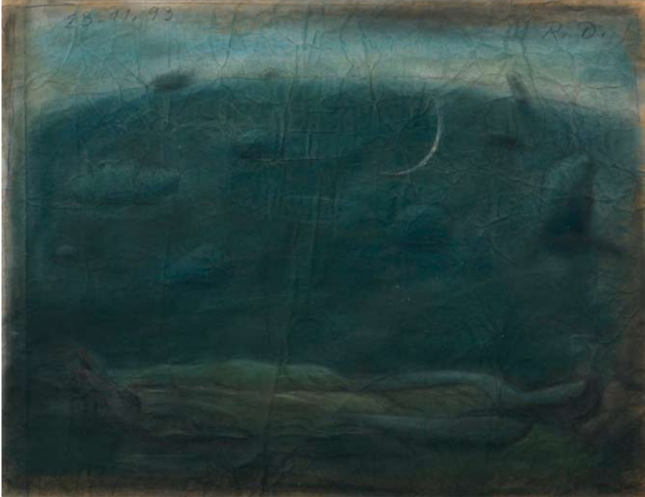
Die Nacht am kahlen Berge 1993 Bleistift, Pastell, 41,5 x 54 cm