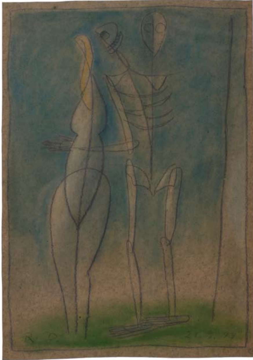
Das Mädchen und der Tod 1999 Bleistift, Pastell, 51 x 35,5 cm